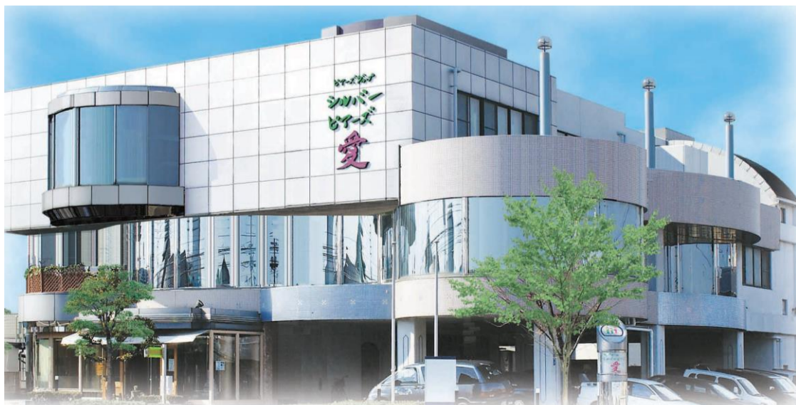
ピアーズグループ 本社ビル